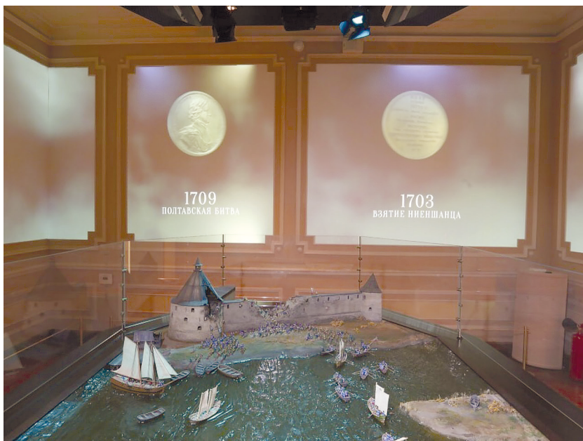
Рис. 13. Историко-культурный проект «Ораниенбаум сквозь века». Зал «Штурм крепости “Орешек”».