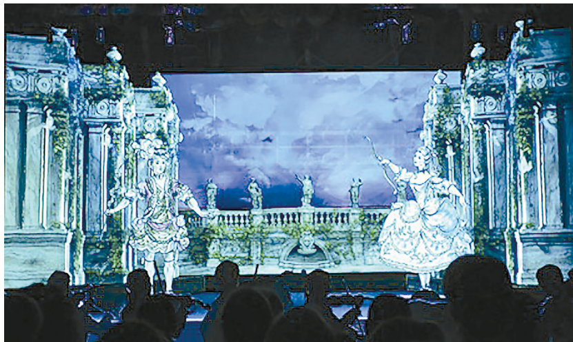
Рис. 7. Театральный зал Картинного дома в Ораниенбауме. Спектакль «Рождение русской оперы».

третий представляет собой законченный фрагмент оперы «Цефал и Прокрис» Франческо Арайи. Необычное представление по сценарию, созданному на основе исторических исследований, подтвержденных документами и артефактами, облеченное в театральную форму, стало следующим шагом на пути внедрения мультимедийных технологий в музейное пространство. Оно ежедневно предлагается вниманию посетителей музея и, входя в каждую обзорную экскурсию по Картинному дому, дарит зрителям эффект реального присутствия на спектакле в зале императорского театра. Мультимедийное решение сценического оформле-