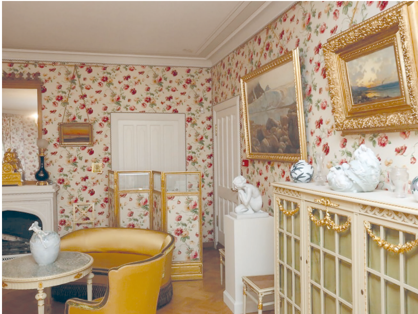
Рис. 10. Историко-культурный проект «Петергофские дачники». Зал «Дамский будуар».