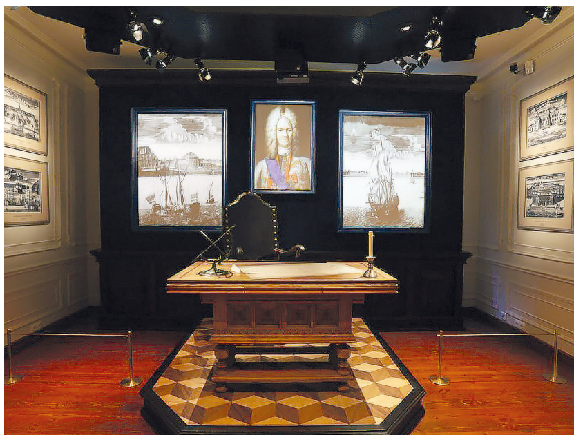
Рис. 14. Историко-культурный проект «Ораниенбаум сквозь века». Рабочий кабинет А. Д. Меншикова.