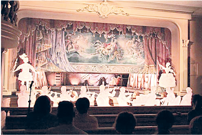
Рис. 6. Театральный зал Картинного дома в Ораниенбауме. Спектакль «Рождение русской оперы».