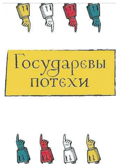
Рис. 1. Фирменный стиль проекта «Государевы потехи».

Специально для проекта «Государевы потехи» был разработан фирменный стиль музея по мотивам работ художника Виталия Ермолаева, подчеркивающий оригинальность нового пространства 5 (рис. 1). Перед началом осмотра залов зрителю предстоит знакомство с установленным на интерактивном столе познавательным игровым приложением, с помощью которого он может узнать, какие личностные особенности русских императоров схожи с его