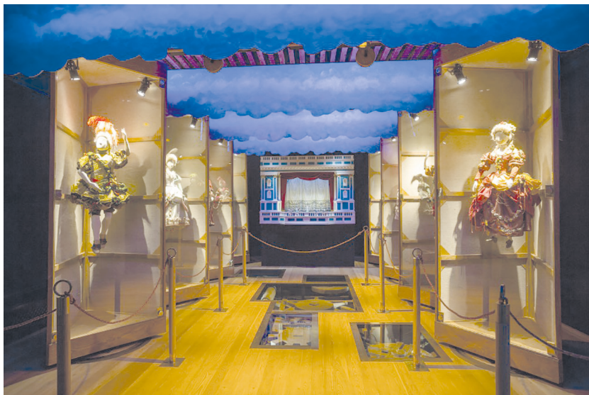
Рис. 3. Историко-культурный проект «Государевы потехи». Зал «Там одна за бава следует за другою...» Петергофский театр».

типу исторических поворотными кулисными механизмами. Необычная конструкция позволяет представить сценическую «машинерию» XVIII столетия, а силуэты элегантных дам и кавалеров, написанные на стенах в ложах летнего театра, иллюзорно создают ощущение наполненности пространства театральными зрителями (рис. 3).