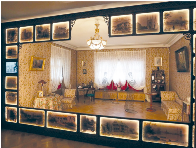
Рис. 12. Историко-культурный проект «Петергофские дачники». Зал «Императорские дачники».

Информационные технологии использованы в этом проекте в принципиально новых вариантах: мультимедиа отходят на второй план, а ведущую роль играет художник — режиссер пространства, который, следуя основной концептуальной идее, создает образ каждого зала. На всем пути зритель встречает в огромных зеркалах отражения таинственных незнакомок в белых платьях и летних шляпах, в одной из них угадывается облик знаменитой дачницы из Стрельны Матильды Кшесинской. В залах стоят необычные предметы: сложноустроенный «шкаф-часы», который, подобно телевизору, «высвечивает» фрагменты дачной жизни, показывая время купания, чаепития, вечерних забав.