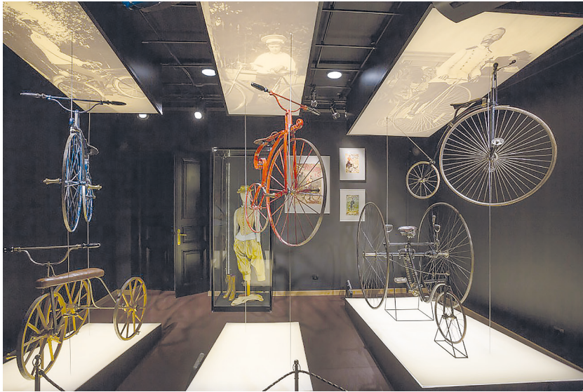
Рис. 5. Историко-культурный проект «Государевы потехи». Зал «Императорские велосипеды».

вестных по историческим и литературным описаниям, который невозможно донести до зрителя традиционными музейными средствами. Построенный на принципах объединения музейности, театральности и интерактива, историко-культурный проект «Государевы потехи» приобретает современный формат изложения, рассчитанный на разные возрастные аудитории.