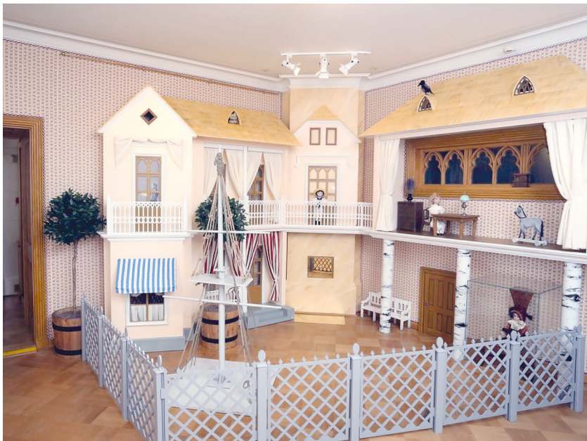
Рис. 11. Историко-культурный проект «Петергофские дачники». Зал «Дачная детская».