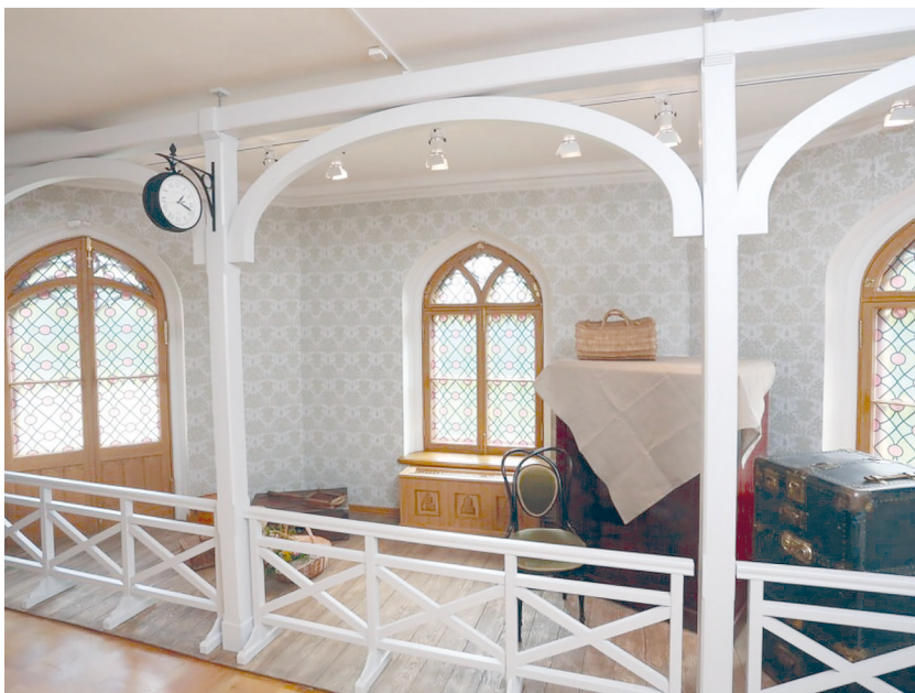
Рис. 8. Историко-культурный проект «Петергофские дачники». Зал «Железнодорожная станция».