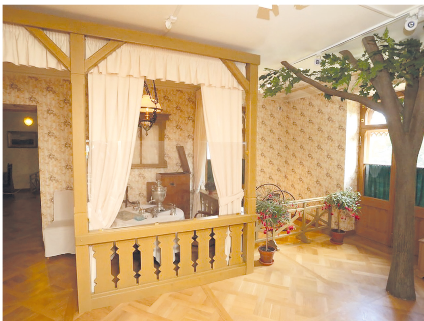
Рис. 9. Историко-культурный проект «Петергофские дачники». Зал «Дачная веранда».